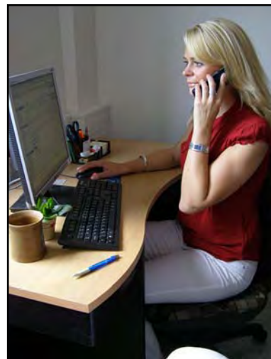
Obr.: Ověřování informací