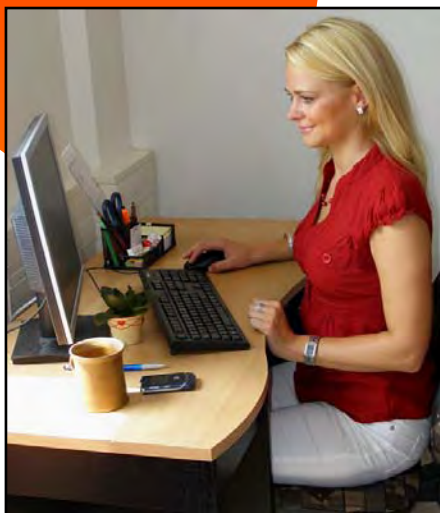
Obr.: Využívání informačních technologií

Počítačové podvody, úniky dat, pomluvy, škodlivé kódy a viry, spamy – tyto všechny představují nebezpečí, které si mnohdy neuvědomujeme. Hasičský záchranný sbor JmK ve spolupráci s Policií ČR – Městské ředitelství Brno a Diecézní charitou Brno Vám poradí, jak se vyhnout nepříjemnostem, spojených s tímto nebezpečím.