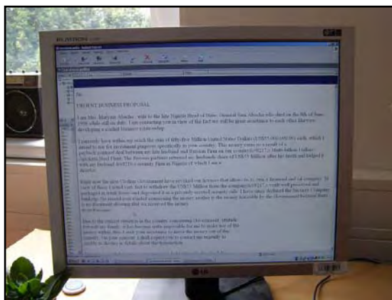
Obr.: Detail tzv. nigerijského dopisu